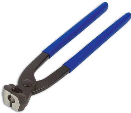
Hose Clip Pliers | 3881